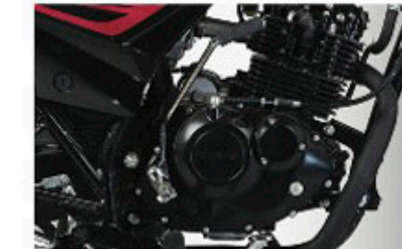
150cc Engine with 5-Speed Gear System