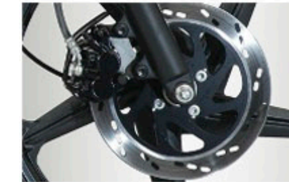
Front Disc Brake