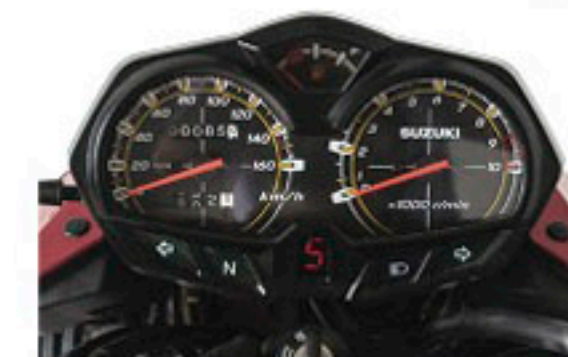
Digital Gear & Fuel Indicator