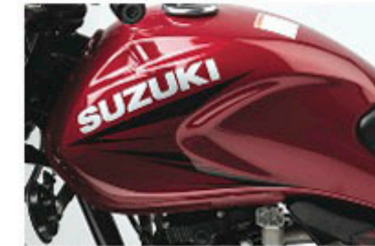
Stylish & Aero-Dynamic Fuel Tank