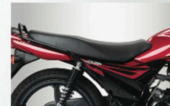
Stair Type Comfortable Seat

سوزوکی موٹر کارپوریشن، کوئی نوٹس دینے بغیر ایکویٹیٹس آئیٹمز، رنگ، مٹیریل اور دوسری چیزوں کو مقامی حالات کے مطابق بدلنے کا حق محفوظ رکھتی ہے۔ کوئی بھی ماڈل نوٹس دینے بغیر منقطع کیا جاسکتا ہے۔ براہ مہربانی اپنے ڈیلر سے اس طرح کی تبدیلیوں کی تفصیلات کیلئے رجوع کریں۔ ہاڈی کے اصل رنگ بک لیٹ میں دیئے گئے رنگوں سے مختلف ہو سکتے ہیں۔ ہمیشہ ہیلمٹ استعمال کریں۔ آنکھوں کے ہپاؤ کیلئے حفاظتی چشمہ بھی آپ کے زیر استعمال رہنا چاہئے۔ اپنا "اورینٹیشنل" نمبر سے پڑھئے اور محفوظ سوار ایک الٹھ اٹھائیے۔